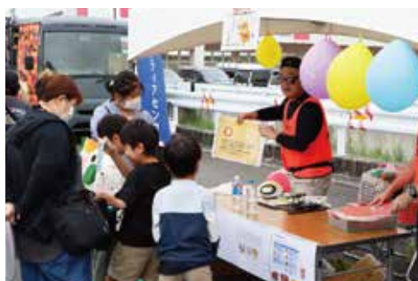
鈴鹿市社会福祉協議会／防災クイズ