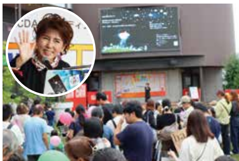
Monet / 絵本朗読 & 歌