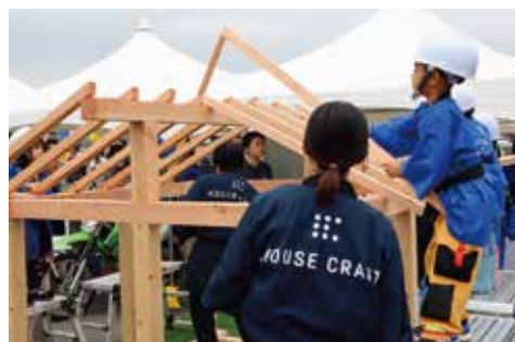
ハウスクラフト／子ども工務店