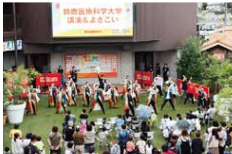
鈴鹿医療科学大学 / よさこい部