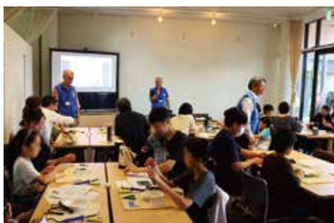
三重県電波適正利用推進員／親子電波教室