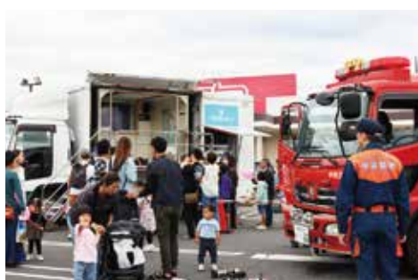
消防車の展示、起震車による地震体験