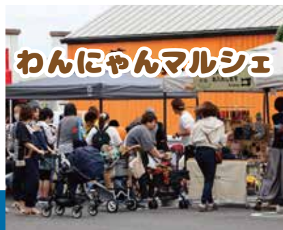
わんにゃんマルシェ