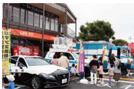
パトカー・DJ ポリスカー等の展示