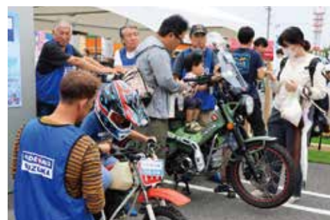
ライド・エイド鈴鹿／災害救助用バイク展示