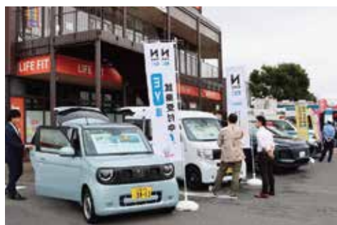
電気自動車の展示／ICDA ホールディングス