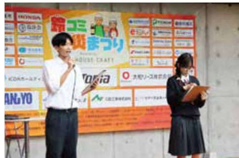
神戸高校放送部 / 公開番組収録