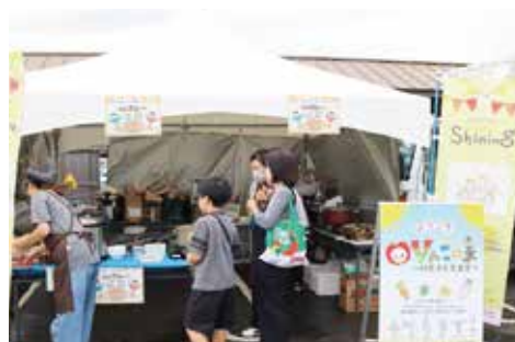
NPO 法人 Shining / 子ども食堂