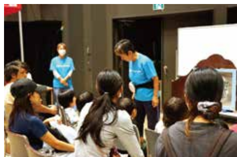
ウミガメネットワーク三重／紙芝居・ウミガメなりきり体験