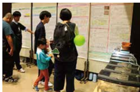
鈴鹿高校自然科学部／鈴鹿川の生物展示