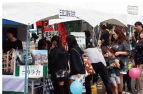
三田工業／企業紹介ブース