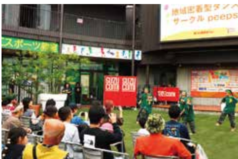
peeps / ダンスパフォーマンス