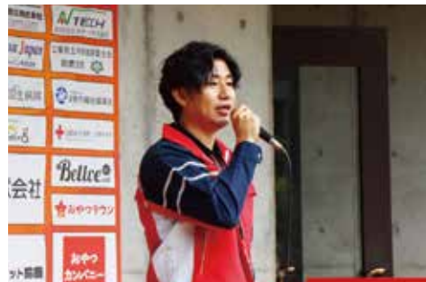
鈴鹿市 / 防災講演