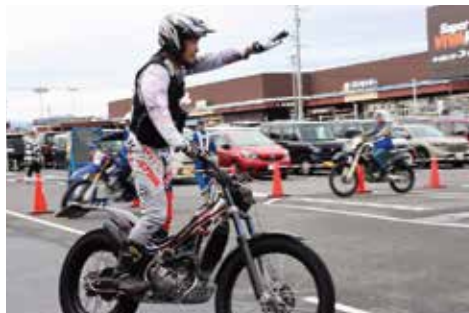
ライド・エイド鈴鹿 / バイクパフォーマンス