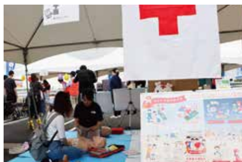
日本赤十字社／応急処置体験