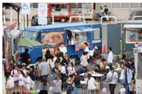
多数のキッチンカーブース