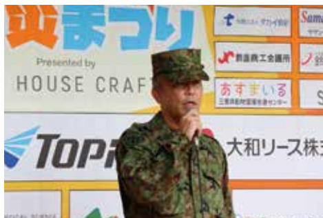
自衛隊 / 防災講演