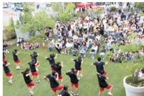
三重高校ダンス部 / パフォーマンス