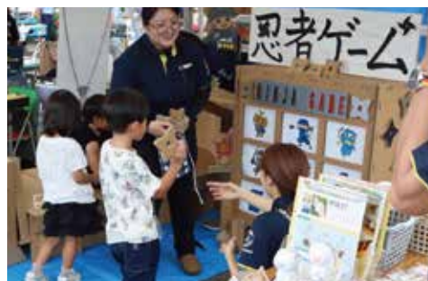
和光紙器／体験型ゲーム