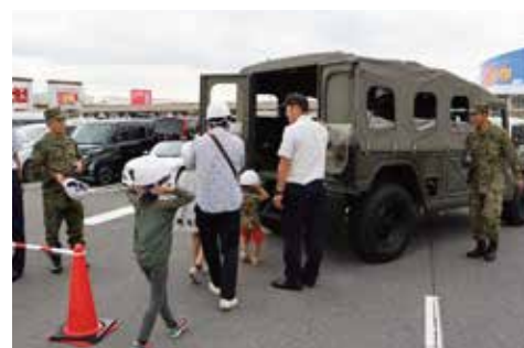
自衛隊／高機動車の体験搭乗