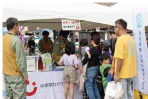
中部電力／停電情報お知らせサービス PR