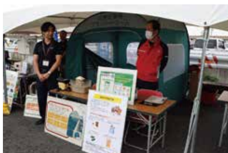
鈴鹿市／災害啓発ブース