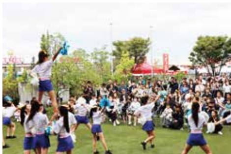
Sparkle☆Gem / ダンス