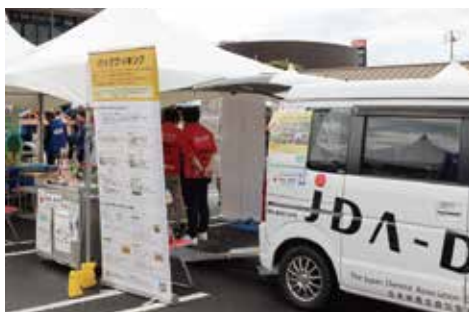
鈴鹿医療科学大学／JDA-DAT 展示