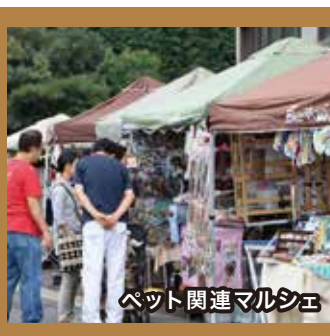
ペット関連マルシェ