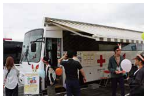
赤十字血液センター／献血車両の展示