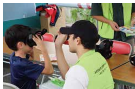
三重県／災害 VR 体験