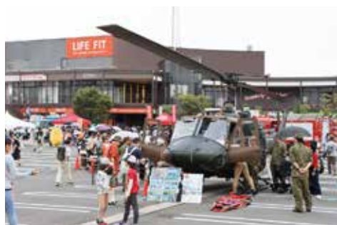
自衛隊／ヘリコプターの展示