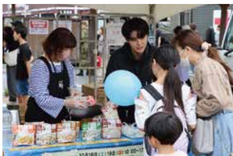
アイリスオーヤマ／保存食試食