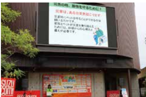
あすまいる / 講演・ペットと防災